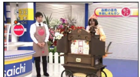
(2012年12月14日 NHK あさイチ)